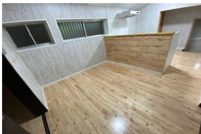
空き家リフォーム後の家