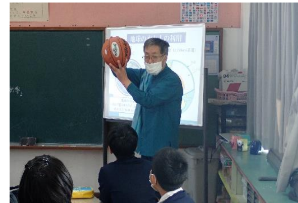
↓環境教育授業の様子↑