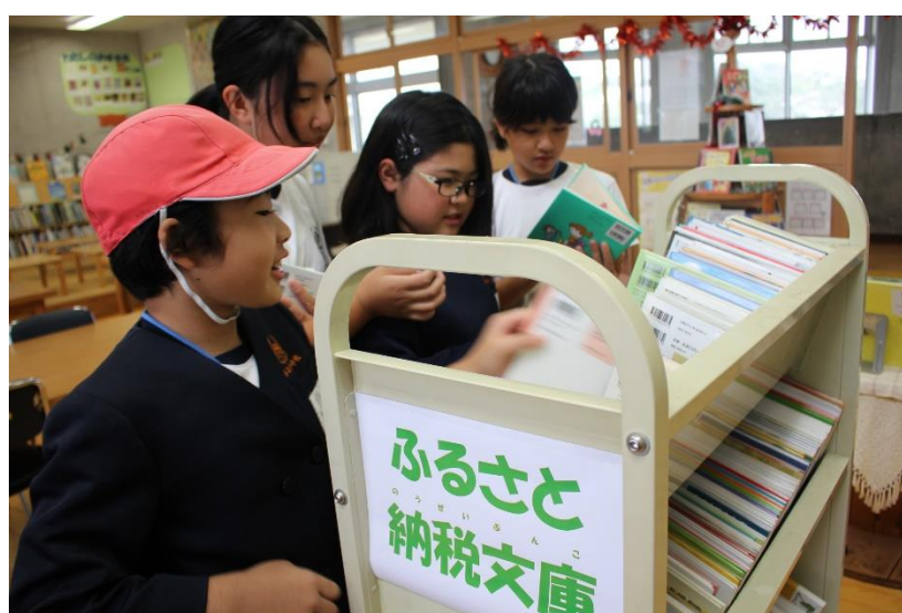
ふるさと納税より購入された本(一部)